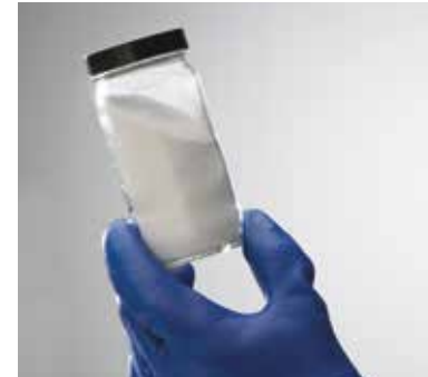
Immagine del PersulfOx