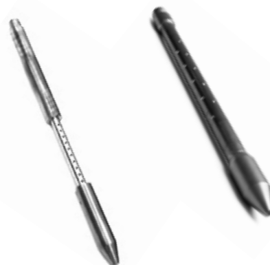
Fig. 2: Punta perforada retráctil (izquierda) y punta perforada para inyección de arriba hacia abajo (derecha)