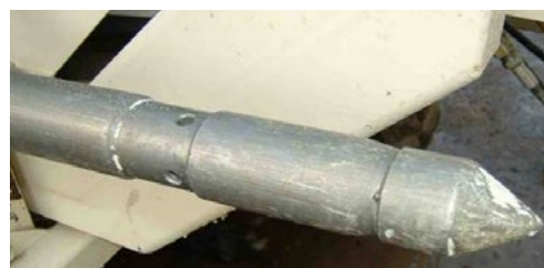
Fig. 3: Punta activada por presión