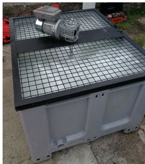
Fig. 1 RegenOx Part A en el tanque de mezcla