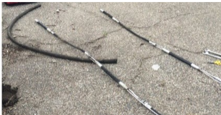
Fig.5: Tuberías para puntos fijos con válvulas (izquierda) y obturadores inflables dobles para inyección en puntos fijos con válvulas (derecha)